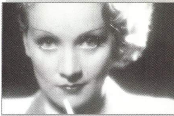
בשער: מרלן דיטריך

עיתון פנדורה - מגזין לסבי דו-חודשי גיליון מס' 4, אוקטובר 2003