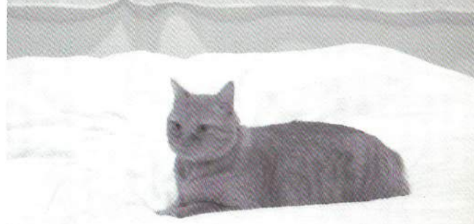
בשער: המיטה הלסבית - המיתוס ושברו.

עיתון פנדורה - מגזין לסבי דו-חודשי גיליון מס' 5, דצמבר 2003