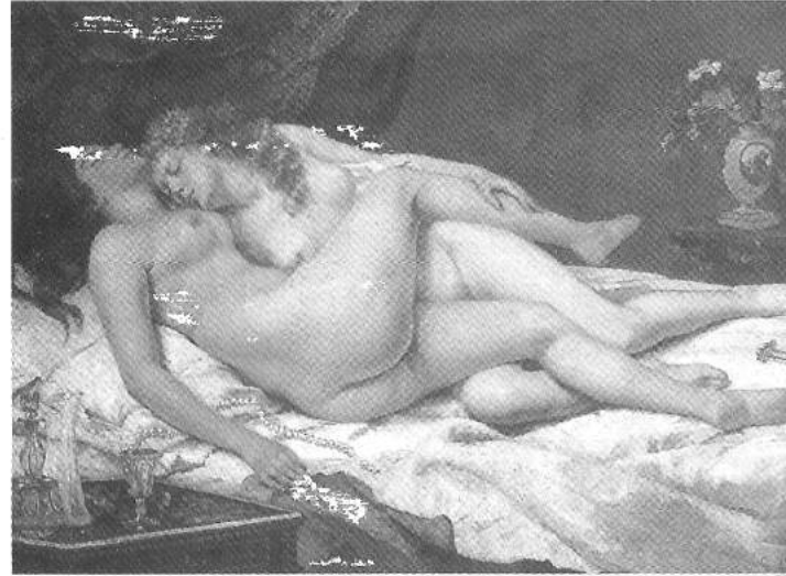
בשער: "השינה". גוסטב קורבה

פנדורה - עיתון לסבי גיליון מס' 2 יוני 2003